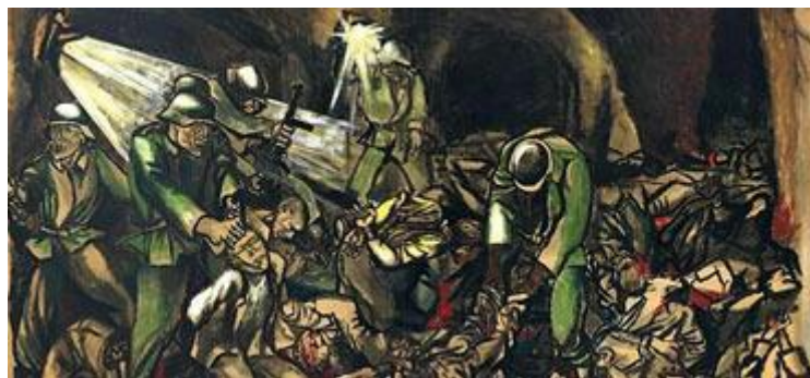
Renato Guttuso, Fosse Ardeatine , 1950.

Nell'ambito del Calendario civile del Bibliopoint Di Vittorio il nostro Istituto propone un percorso di letture e documenti visivi sulla strage delle Fosse Ardeatine, uno degli episodi più tragici della Resistenza italiana al nazifascismo e un evento indelebile nella storia di Roma.